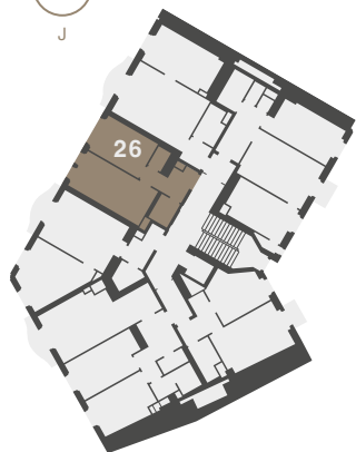
Půdorys podlaží Umístění bytu na patře